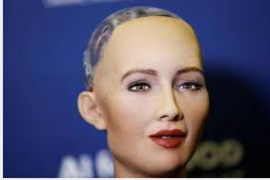
- Sophia, primera ciudadana robotizada (Arabia Saudita)

La inteligencia artificial aparece en esta etapa irreversible y mucho más avanzada de lo que muchos podrían imaginar. Está en los satélites en el espacio, incrustada en nuestros sistemas informáticos y en laboratorios subterráneos entre muchos otros lugares. Vemos una nueva religión de la Inteligencia Artificial llamada Camino del Futuro . Sophia fue el primer robot en obtener la ciudadanía en Arabia Saudita y está iniciando su propia divisa. El primer oficial de policía robot acaba de ser nombrado en Dubái. El negocio de los robots sexuales está creciendo exponencialmente. Bill Gates está creando una ciudad inteligente "robotizada" en el desierto de Arizona, y Arabia Saudita está construyendo Neom, una ciudad más grande que Dubái con más robots que humanos.