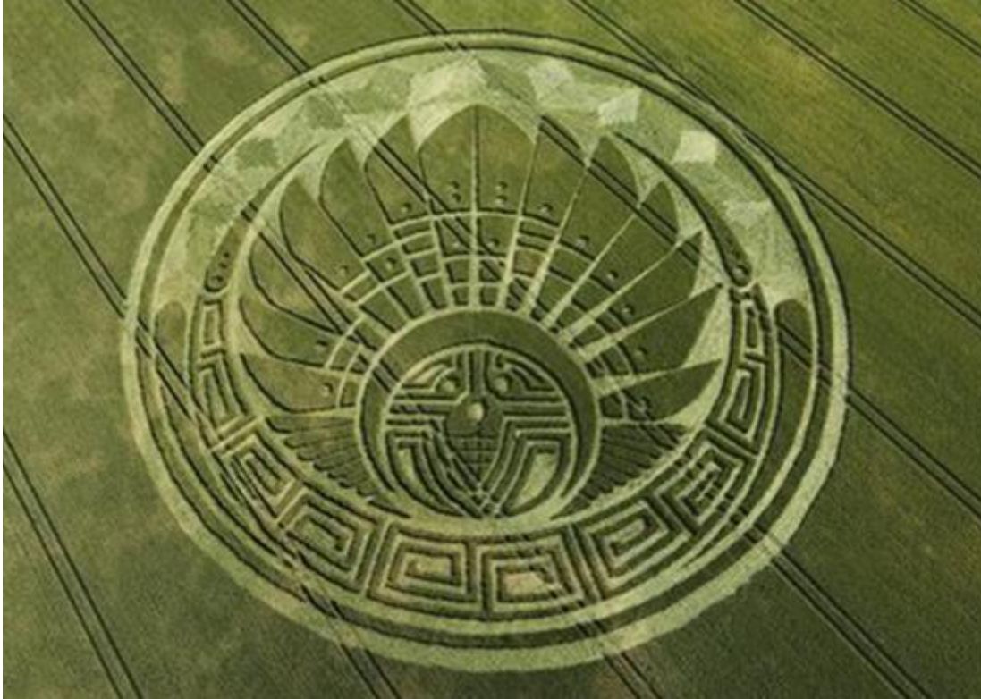
Círculo de Cosecha del “Penacho de Quetzalcóatl” del 5 de Julio de 2009, Kin 88: Estrella Planetaria Amarilla, signo de Venus

José Argüelles/Valum Votan trajo un sistema de conocimiento galáctico completamente nuevo basado en el estudio de las matemáticas subyacentes y las profecías del calendario Maya. Él revivió y promovió el calendario de 13 Lunas/28 días como una herramienta universal para armonizar con el tiempo sincrónico. Al igual que Quetzalcóatl, él tenía la Misión de renovar las artes y la cultura como el factor principal de la civilización expresada por la filosofía Tiempo es Arte .