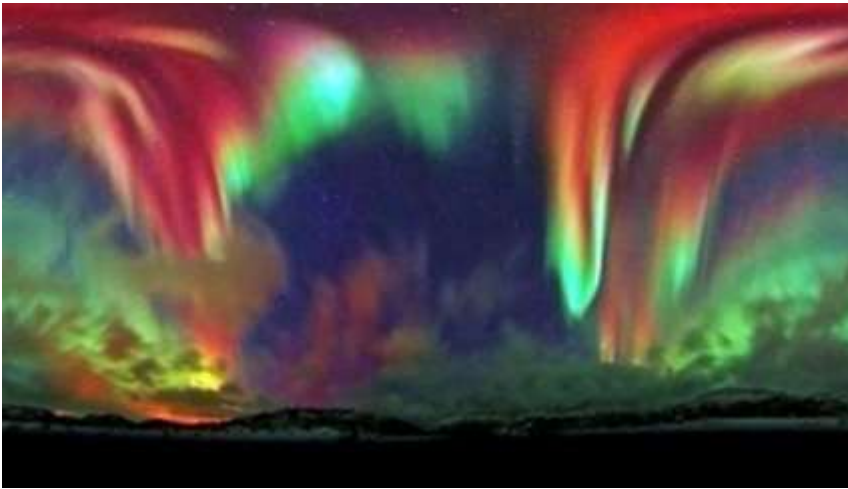
‘Aurora Llena el Cielo sobre Noruega’

Más alta que el edificio más alto, más alta que la montaña más elevada, más arriba que el avión más alto, se encuentra el reino de la aurora. Las Auroras rara vez llegan por debajo de los 60 kilómetros, y pueden extenderse hasta 1000 kilómetros. Las luces de la Aurora resultan de electrones y protones energéticos que golpean las moléculas en la atmósfera de la Tierra. Con frecuencia, cuando se observa desde el espacio, una aurora completa aparecerá como un círculo alrededor de uno de los polos magnéticos de la Tierra.