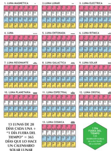
TRECE LUNAS PERFECTAS

permitiendo afinar la mente con las espirales infinitas de la evolución de la conciencia. Una vez liberados del círculo cerrado del reloj y la medida artificial del calendario de 12 meses nos hemos podido dar cuenta de que estamos limitados por el espacio e ignorantes del tiempo.