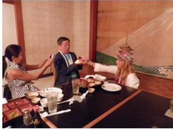
— Ofreciendo la Calavera de Cristal. Espejo Entonado Blanco, Luna Galáctica 5 (2 de Marzo de 2013) Hilo, Hawaii.

La calavera de cristal era una de las dos calaveras que me dieron en Australia para llevar a Palenque, México para el cierre del Gran Ciclo el 21 de Diciembre de 2012, Kin 207.