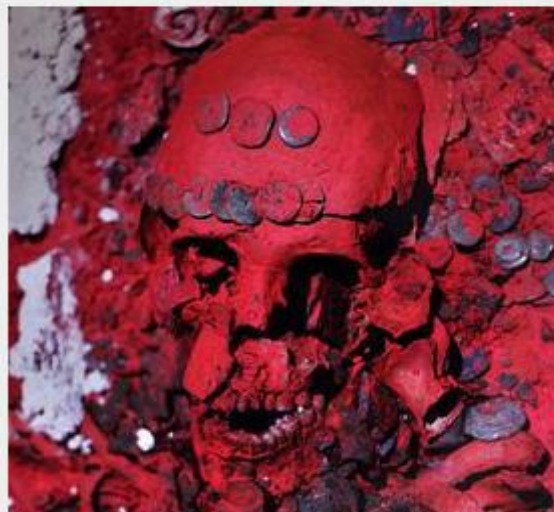
— Cráneo de la Reina Roja con rojo cinabrio. En Palenque el Templo 12 es el Templo de las Calaveras y en el Templo 13 se encuentra la tumba de la Reina Roja.