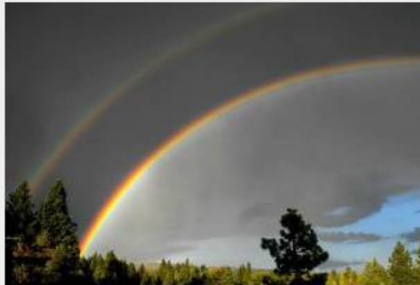
— Foto tomada la tarde de la Semilla Galáctica Amarilla después de la Ceremonia de Resurrección al Amanecer, en el monte Shasta: 26 de Julio de 2013.

La Gran Madre, Isis, también estuvo presente en el "nacimiento" del nuevo rayo galáctico; ella ES el nuevo rayo resucitado a través de la unión de los opuestos: la alquimia suprema de la Divina Femenina y lo Divino Masculino. El equilibrio y la resolución entre lo masculino y lo femenino dentro de cada uno de nosotros, nunca ha sido más urgente.