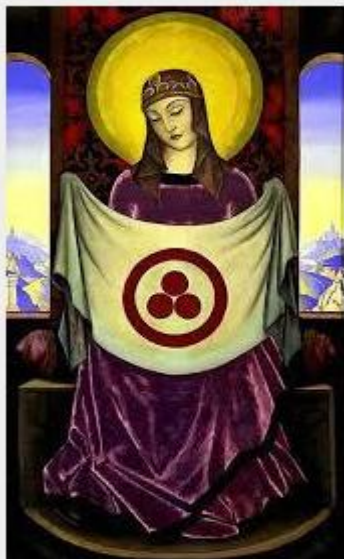
— La Madre del Mundo sosteniendo la Bandera de la Paz (N. Roerich)

La Bandera de la Paz contiene tres círculos rojos unidos por un círculo rojo más grande de unidad que significa Una Sangre . Sirio está conectado con el color rojo porque se