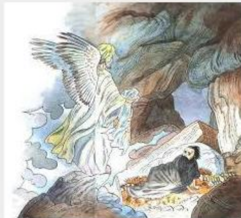
— Mahoma recibiendo la transmisión celestial del Santo Corán del ángel Gabriel

http://www.space.com/25409-cuatro-sangre-lunas-tétrada-lunar-eclipse.html