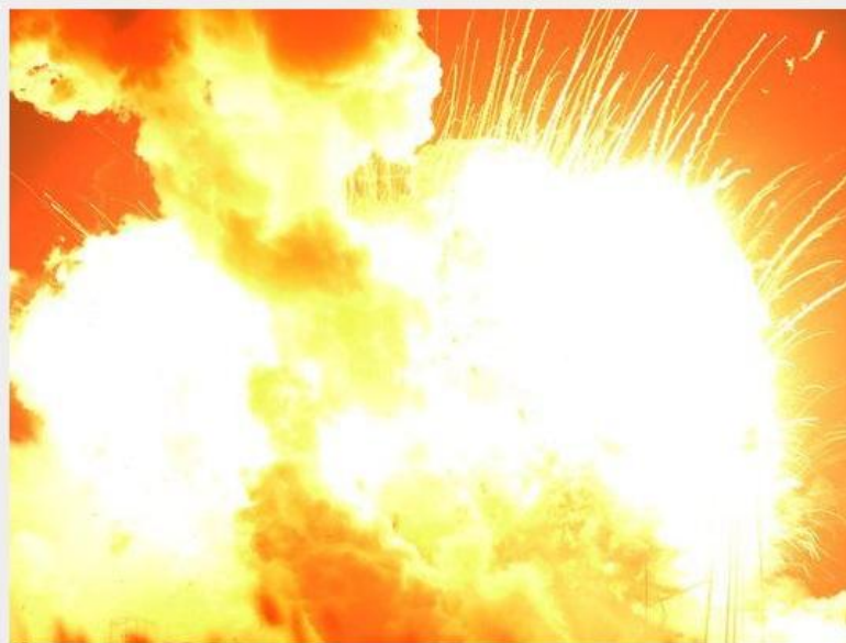
—Explosión del cohete Antares, Noche Cristal Azul, Kin 103 (28 Octubre 2014)

A la luz de GM108X, ¿qué significan los accidentes de las Naves Espaciales actuales?