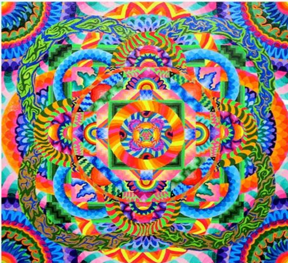
—Pintura de José Argüelles de 1968. La RAP fue concebida como una red global de artistas que unirían sus fuerzas para crear la transformación planetaria positiva. El propósito principal de la RAP era la realización de la Tierra entera como una obra de arte.

En Crónicas del Planeta Arte , Argüelles describe un universo paralelo futurista donde la telepatía es la norma y donde el ARTE es más poderoso que la tecnología mecanicista . Mientras escribía este libro la corriente paralela 108X se le reveló por primera vez.