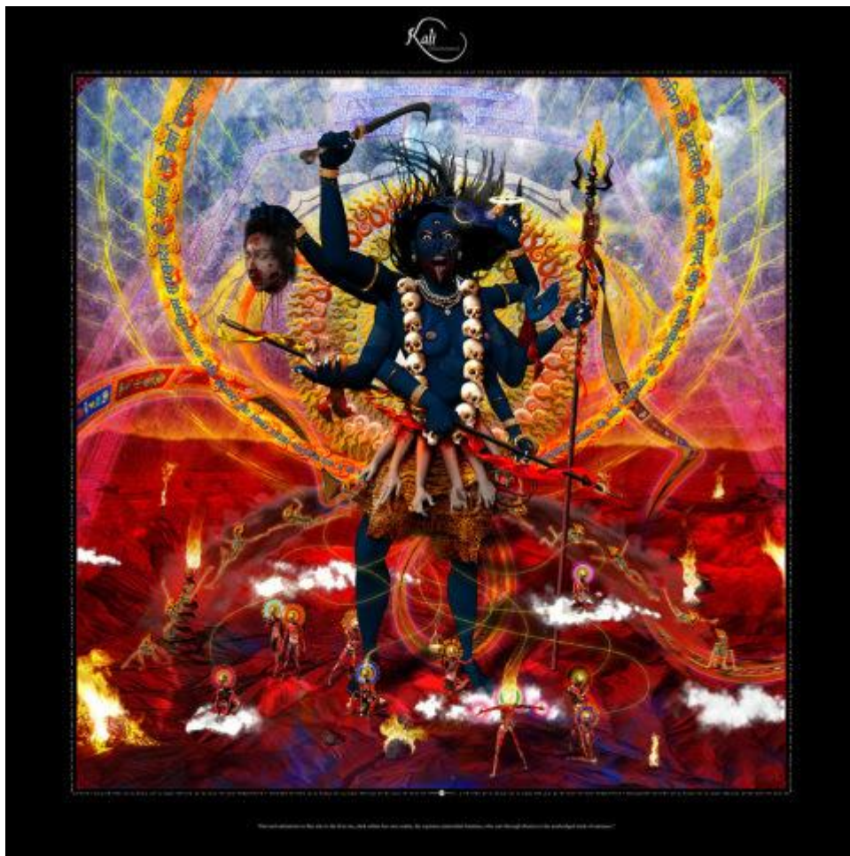
- KALI YUGA

La raíz de la conexión de Mahoma con Abraham era la Kaaba (cubo) que alberga una piedra celestial que "cayó del cielo". Algunos relatos dicen de la piedra, que una vez era blanca, se volvió negra con los "pecados de Adán". Volver al negro está relacionado con el concepto hindú del Kali Yuga –la edad oscura en la que estamos ahora.