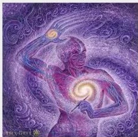
— Alex Grey

Somos seres multifacéticos. Debemos abrazar todas las partes de nosotros mismos y clarificar nuestras necesidades. Identificar nuestras necesidades es parte del proceso de convertirse en un todo. Cada uno somos un niño pequeño en constante renacimiento de nosotros mismos. Se requiere disciplina en este proceso. Pero la disciplina no debería sentirse obligatoria, sino algo tan emocionante como trabajar en una obra de arte.