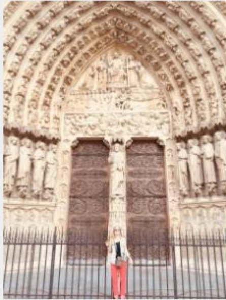
— Portal del Juicio Final. Luna Magnética 3: Dragón Cósmico Rojo, año de la Tormenta Espectral Azul. 28 de julio de 2016. Foto del Kin 218.

Aquí hay 13 datos interesantes sobre la catedral de Notre Dame: