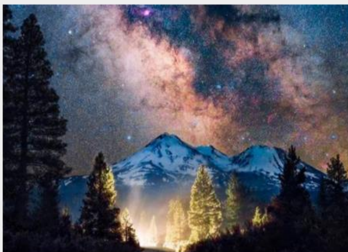
— El monte Shasta era un sitio sagrado clave al que la gente acudió durante la Convergencia Armónica.

Uno de los principales propósitos de la reunión de los 144.000 fue activar el sistema de red planetaria, la estructura etérica de la Tierra o el cuerpo de luz de la Tierra. La premisa de la plantilla planetaria se basa en la posición de monumentos antiguos específicos cuya ubicación presupone ciertos puntos de energía geomagnética. La conexión entre todos los diferentes puntos de energía, se conozcan o no, constituye la red planetaria de la Tierra.